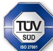
Michael Fernald Head of Central Certification Body Page 1 of 10

Dieses Zertifikat ist gültig vom 24. September 2024 bis 29. Juli 2027 Mit einem Neuausgabedatum am N/A Unter Berücksichtigung der Erklärung zur Anwendbarkeit: MD-IMS-02 04 de (SOA Erklärung zur Anwendbarkeit): Version 3.0, as of 27.03.2024